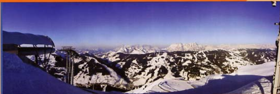
Grafik Werbung Null | Zell am See

Im Sommer bequem mit dem Auto über den Schönleitengeweg – eine gut ausgebaute 8,5 km lange Naturstraße, deren Benützung für unsere Hausgäste natürlich kostenlos ist.